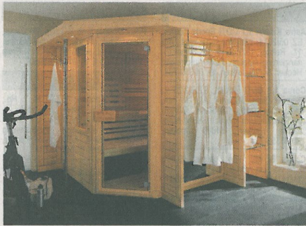
Luxuriös Schwitzen in den eigenen vier Wänden: Massive Blockbohlen-Sauna nach Maß.

Wo vorher ein Kleiderschrank eingebaut war, wohltuendem Schwitzvergnügen frönen? Eine Dachkammer zur persönlichen Wellness-Oase umfunktionieren oder die ungenutzte Ecke im Badezimmer sinnvoll und stylish mit einer Designsauna aufwerten? Kein Problem mit einer individuell an die Raumproportionen angepassten Blockbohlensauna,