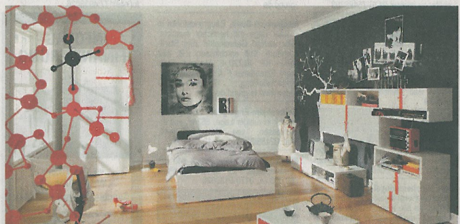
Wandheizungen sind unsichtbar - der Wohnraum kann daher ohne Hindernisse eingerichtet werden.

Wohnen ganz ohne Heizkörper - für Inneneinrichter ist das die Lösung, um keine Rücksicht auf sperrige Heizkörper nehmen zu müssen. Sie nutzen damit eine Quelle, die schon die alten Römer kannten: Strahlungswärme durch Wandheizungen. In Neubauten oft im Einsatz, sind Wandheizungen auch im Rahmen von umfangreichen Altbau-Modernisierungen nachträglich einsetzbar. Die fertigen Wandheizungselemente mit integrierten