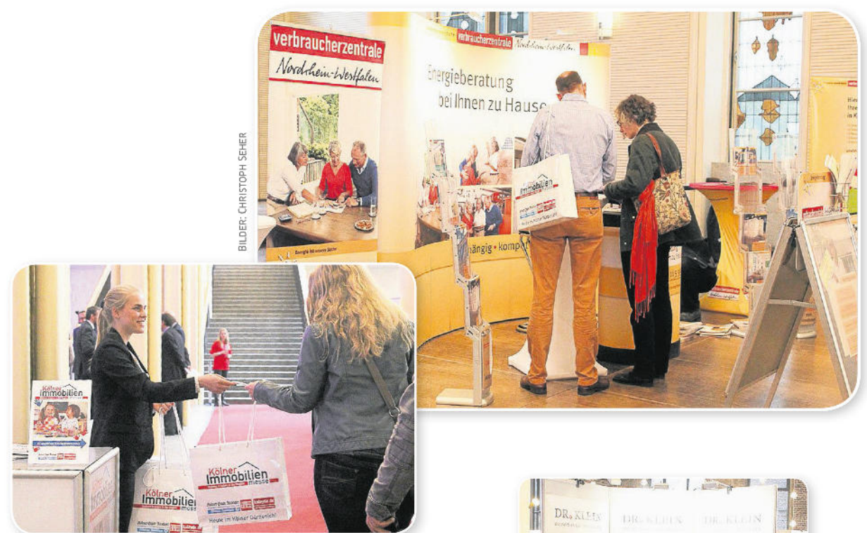
BILDER: CHRISTOPH SEHER